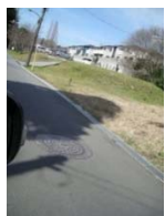
ゆりのきの丘からの通学路の側溝にふたを設置しました