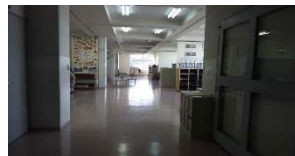
アレルギーを持つ在校生のため萱田小・萱田中学校のジュータンを取りました