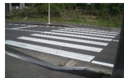
ゆりのき台学童前の歩道を引き下げました