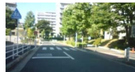
萱田、パークシティ、萱田南小学校前、ゆりのき学童前に横断歩道を設置しました