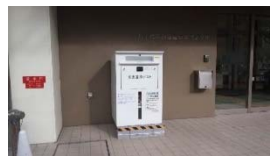
生涯学習プラザ前にブックポストを設置しました。