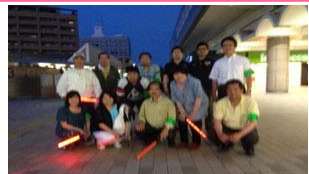
ゆりのき地区を防犯のために夕方パトロール