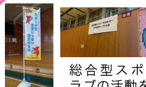
総合型スポーツクラブの活動を応援・参加しています

その他、21世紀クラブに参加して敬老の方の健康増進のお手伝いをしています。ゆりのき台8丁目自主防災会で副会長として地域の防災活動に取り組んでいます。