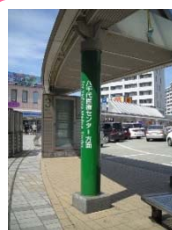
八千代中央駅前医療センター行バス亭の表示をわかりやすく改善しました