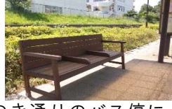
ゆりのき通りのバス停にベンチを設置するにあたり、オカムラホームと萱中を橋渡しして共同で制作していただきました