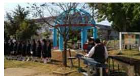
パーゴラの会に参加し、萱田小にパーゴラを復活設置しました